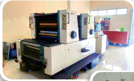
Mesin Oliver 722