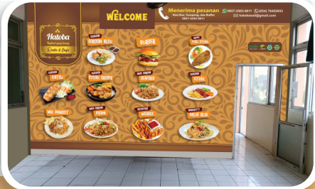
Produk Banner / Backdrop