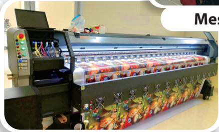
Mesin MMT Outdoor