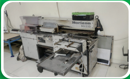
Mesin Binding Horizon